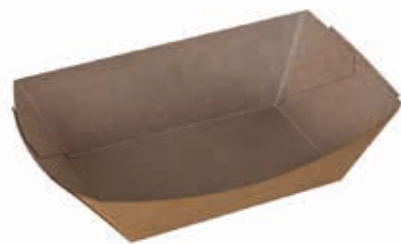
Food-Schale M* 10,7 cm x 6,9 cm x 4,1 cm Art.-Nr. 506026