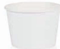
Becher W130 (GE-108) 140 ml/Höhe 53 mm/Ø 73 mm Art.-Nr. 508216 + PET-Domdeckel (Art.-Nr. 512096)