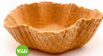
Erdbeer Schale Flora Höhe 45 mm/Ø 135 mm Art. Nr. 618594