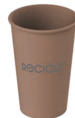
Mehrweg-Trinkbecher Cold & Hot L braun ca. 325 ml/Höhe 115 mm/Ø 80 mm Art.-Nr. 525115 + Mehrweg-Deckel schwarz (Art.-Nr. 525130) + Flachdeckel rPET mit Kreuzschlitz (Art.-Nr. 512011) + Pappdeckel Kombi weiß (Art.-Nr. 516121)