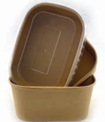
Deckel für Schale 500 ml - 1000 ml Kraft-Deckel 177 x 124 mm (Art.-Nr. 519119) PP-Deckel 173 x 120 mm (Art.-Nr. 519118)*