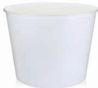
Becher W2950 (99oz) 2950 ml/Höhe 147 mm/Ø 188 mm Art.-Nr. 508274 + Flachdeckel ohne Loch (Art.-Nr. 512160)