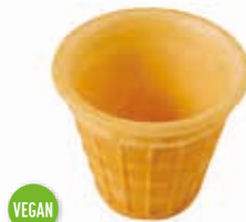
Eisbecher mittel Höhe 52 mm/Ø 65 mm Art. Nr. 618560