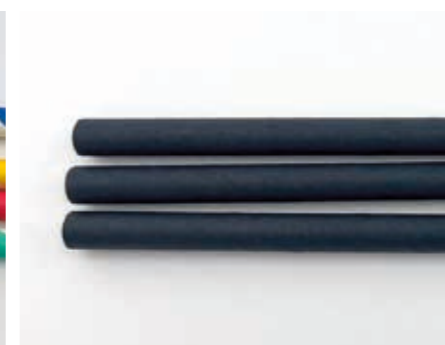
230 mm/Ø 8 mm schwarz Art.-Nr. 579131