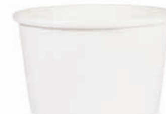
Becher W800 (GE-M7) 800 ml/Höhe 82 mm/Ø 134 mm Art.-Nr. 508252 + PET-Flachdeckel (Art.-Nr. 512111) + PET-Domdeckel (Art.-Nr. 512110) + Pappdeckel (Art.-Nr. 512209) + Pappdeckel mit Holzspaten (Art.-Nr. 512210)