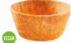
Becher Greta 120 ml Höhe 39 mm/Ø 80 mm Art. Nr. 618498