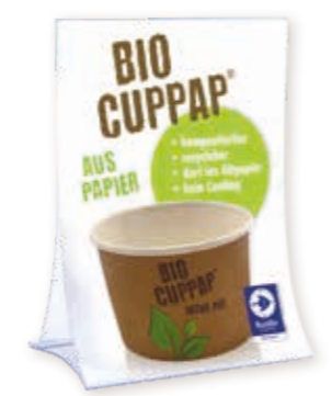
BIO CUPPAP® Werbemittel Vitrinen-/Türaufkleber Acryl-Thekendisplay