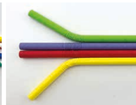
220 mm/Ø 7 mm Jumbo 5-Farbe Mix uni bunt · flex Art.-Nr. 579105