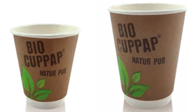
BIO CUPPAP® Hot 200 DW 8 oz/Ø 80 mm Art.-Nr. 514140 + Bagassedeckel für CTG creme (Art.-Nr. 516114) + CPLA Deckel für CTG weiß (Art.-Nr. 516104) + Pappdeckel Kombi (Art.-Nr. 516121) BIO CUPPAP® Hot 300 DW 12 oz/Ø 90 mm Art.-Nr. 514144 + Bagassedeckel für CTG creme (Art.-Nr. 516118) + CPLA Deckel für CTG weiß (Art.-Nr. 516108) + Pappdeckel Kombi (Art.-Nr. 516122)