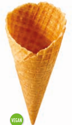
Waffeln Dänemark E 69 süß gedreht · Höhe 170 mm/Ø 70 mm ca. 3-4 Kugel Art. Nr. 618511