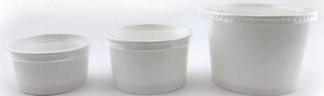
Modell 160 (GE-10) 160 ml randvoll/45 mm/Ø 85 mm Art.-Nr. 508220 + PET-Flachdeckel (Art.-Nr. 512098) + Pappdeckel (Art.-Nr. 512220) + Pappdeckel m. Holzspaten (Art.-Nr. 512221) + Domdeckel PET (Art.-Nr. 512099)