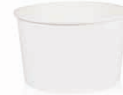
Becher W360 (GE-4MD) 360 ml/Höhe 64 mm/Ø 103 mm Art.-Nr. 508244 + PET-Flachdeckel (Art.-Nr. 512108) + PET-Domdeckel (Art.-Nr. 512109)