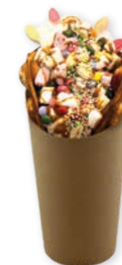
Bubble-Cup maxi uni-Kraft-braun 13,0 cm / Ø oben 8,0 cm / Ø unten 6,0 cm Art.-Nr. 507122