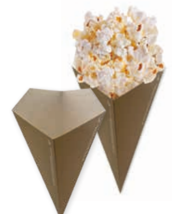
Bubble-Spitztüte maxi uni-Kraft-braun 18,5 cm x 26,0 cm Art.-Nr. 507124