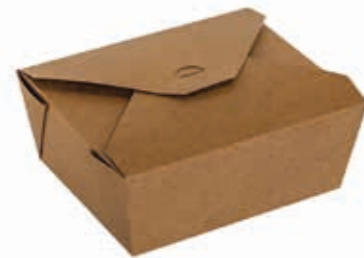
Lunch-Box Kraft 1150* 1150 ml / 15 cm x 12 cm x 6,5 cm Art.-Nr. 506043