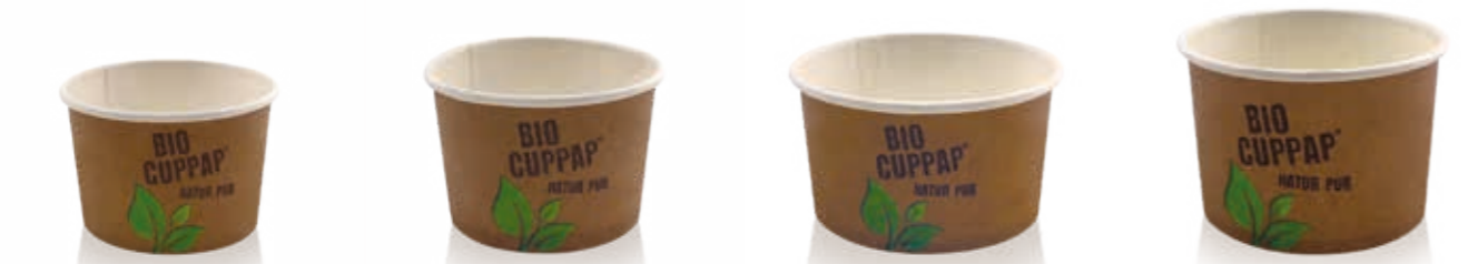
BIO CUPPAP® 100 Höhe 44 mm/Ø 69 mm Art.-Nr. 508706 + Pappdeckel (Art.-Nr. 512222) + Pappdeckel mit Holzspaten (Art.-Nr. 512223) BIO CUPPAP® 120 Höhe 49 mm/Ø 75 mm Art.-Nr. 508716 + PLA-Flachdeckel (Art.-Nr. 512097) + Pappdeckel (Art.-Nr. 516120) BIO CUPPAP® 160 Höhe 46 mm/Ø 90 mm Art.-Nr. 508720 + rPET-Flachdeckel Kreuzschlitz (Art.-Nr. 512012) + Pappdeckel (Art.-Nr. 516122) BIO CUPPAP® 170 Höhe 56 mm/Ø 80 mm Art.-Nr. 508724 + Pappdeckel Kombi (Art.-Nr. 516121)