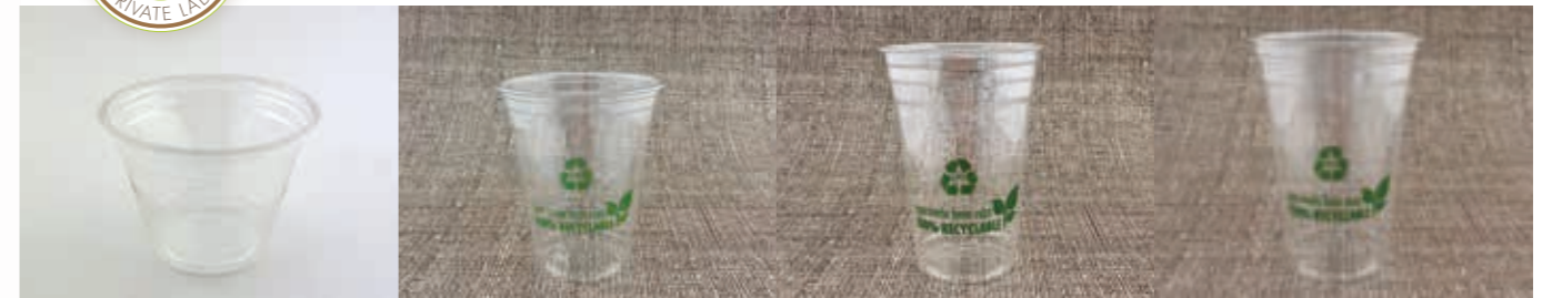
Clear Cup rPET 200 ml/randvoll 255 ml/9 oz Höhe 73 mm/Ø 95 mm Art.-Nr. 534400