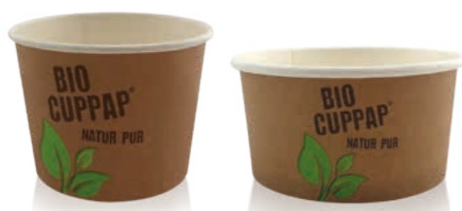
BIO CUPPAP® 500 Höhe 78 mm/Ø 109 mm Art.-Nr. 508748 + PP-Flachdeckel mit Dampfloch (Art.-Nr. 512113) BIO CUPPAP® 580 Spezialitäten-Becher Höhe 65 mm/Ø 132 mm Art.-Nr. 508750 + PET-Hochdeckel (Art.-Nr. 512151)

Die Eisbecher BIO CUPPAP® befreien Sie von der Mehrweg-Angebots-Pflicht und EWK-Gebühr (gemäß heutigem Gesetzesstand)