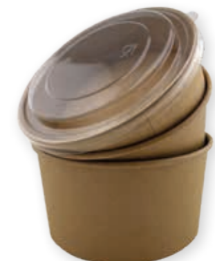
Food-Bowl Kraft 1000 ml* 78 mm/Ø 149 mm Art.-Nr. 506104 + rPET-Deckel 500-1000 ml (Art.-Nr. 506200)