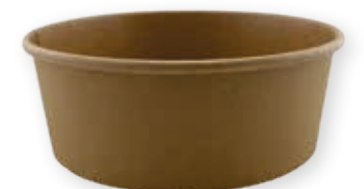
Food-Bowl Kraft 1300 ml* 67 mm/Ø 184 mm Art.-Nr. 506106 + rPET-Deckel 1300 ml (Art.-Nr. 506206)