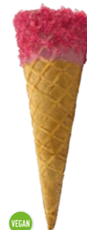
Waffel Greta S5244 rosa Glasur u. Streusel Höhe 160 mm/Ø 53 mm · ca. 2-3 Kugel Art. Nr. 618503