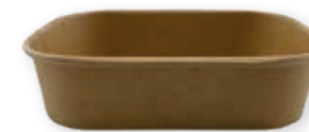
Familien-Packung Kraft 500 ml 173 x 120 x 40 mm Art.-Nr. 519110 + Kraft-Deckel (Art.-Nr. 519119) + PP-Deckel (Art.-Nr. 519118)