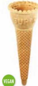
Waffeln Tulpenhörnchen Piccobella Mittel Tulip M E5 gepresst · Höhe 105 mm/Ø 42 mm ca. 1 Kugel Art. Nr. 618505