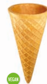
Waffeln Knusperhörnchen klein Höhe 110 mm/Ø 47 mm ca. 1-2 Kugel Art. Nr. 618508