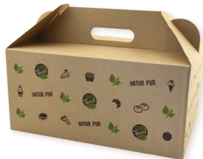
6er-Tragekarton „GOOD FOOD“ 33,6 x 22,8 x 15,8 cm Art.-Nr. 573030