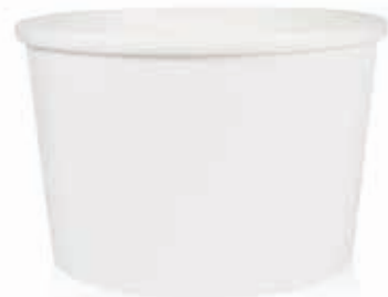
Becher W1100 (M8) 1060 ml/Höhe 93 mm/Ø 143 mm Art.-Nr. 508260 + Flachdeckel PET (Art.-Nr. 512116)