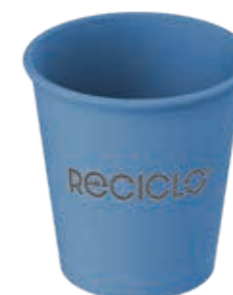
Mehrweg-Trinkbecher Cold & Hot M blau ca. 225 ml/Höhe 82 mm/Ø 80 mm Art.-Nr. 525110 + Mehrweg-Deckel schwarz (Art.-Nr. 525130) + Flachdeckel rPET mit Kreuzschlitz (Art.-Nr. 512011) + Pappdeckel Kombi weiß (Art.-Nr. 516121)