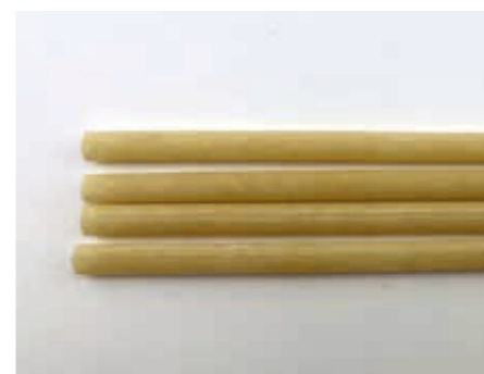
230 mm/Ø 8 mm Trinkhalm aus Bambus Art.-Nr. 579050