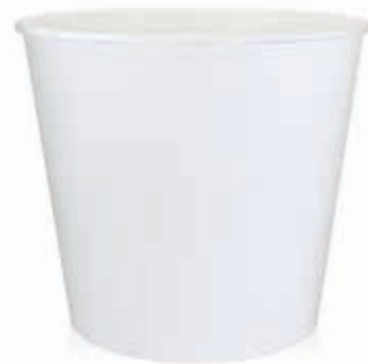
Becher W3850 (130oz) 3850 ml/Höhe 181 mm/Ø 197 mm Art.-Nr. 508275 + Flachdeckel PET (Art.-Nr. 512116)