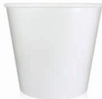
Becher W5520 (187oz) 5520 ml/Höhe 209 mm/Ø 220 mm Art.-Nr. 508278