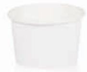
Becher W100F (GE-8) 100 ml/Höhe 44 mm/Ø 69 mm Art.-Nr. 508205 + Pappdeckel (Art.-Nr. 512222) + Pappdeckel mit Holzspaten (Art.-Nr. 512223) + Pappdeckel weiß mit Holzspaten (Art.-Nr. 512127) + Pappdeckel o. Löffel + Farbrand weiß (Art.-Nr. 512129)