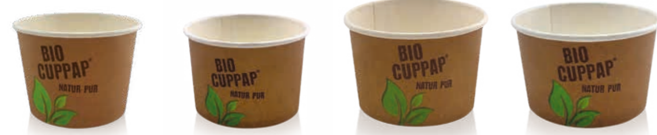
BIO CUPPAP® 225 Höhe 65 mm/Ø 80 mm Art.-Nr. 508728 + Pappdeckel Kombi (Art.-Nr. 516121) BIO CUPPAP® 230 Höhe 57 mm/Ø 90 mm Art.-Nr. 508732 + rPET-Flachdeckel Kreuzschlitz (Art.-Nr. 512012) + Pappdeckel (Art.-Nr. 516122) BIO CUPPAP® 300 Höhe 60 mm/Ø 97 mm Art.-Nr. 508740 + Pappdeckel (Art.-Nr. 516124) BIO CUPPAP® 360 Höhe 62 mm/Ø 105 mm Art.-Nr. 508744 + Kraft-Deckel (Art.-Nr. 508692)