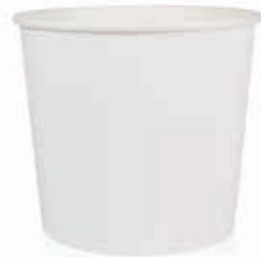
Becher W625 (GE-70) 625 ml/Höhe 97 mm/Ø 109,5 mm Art.-Nr. 508254 + Flachdeckel PP (Art.-Nr. 512113)