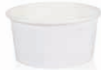
Becher W90 (GE-6) 90 ml/Höhe 38 mm/Ø 73 mm Art.-Nr. 508203