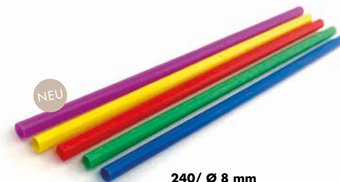
240/ Ø 8 mm Trinkhalm Mehrweg Material: PP · Jumbo bunt für 50 Spülgänge geeignet Art.-Nr. 579150