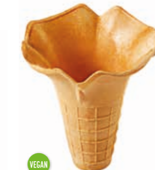
Waffel Becher Magnolia 0530 Höhe 100 mm/Ø 85 mm Art. Nr. 618496