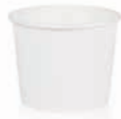
Becher W100H (GE-7) 100 ml/Höhe 51 mm/Ø 65 mm Art.-Nr. 508204 + PET-Domdeckel (Art.-Nr. 512095)