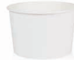
Becher W280 (GE-3M) 280 ml/Höhe 64 mm/Ø 94 mm Art.-Nr. 508236 + PET-Flachdeckel (Art.-Nr. 512104) + PET-Domdeckel (Art.-Nr. 512106) + Pappdeckel (Art.-Nr. 512207) + Pappdeckel mit Holzspaten (Art.-Nr. 512208)