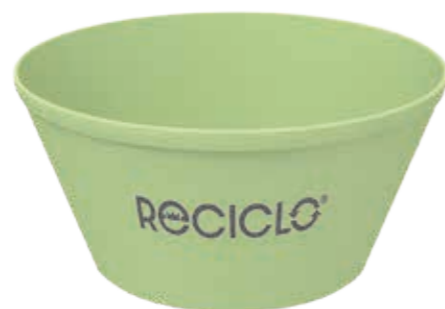
Mehrweg-Becher 600 mint ca. 600 ml/Höhe 70 mm/Ø 140 mm Art.-Nr. 525020