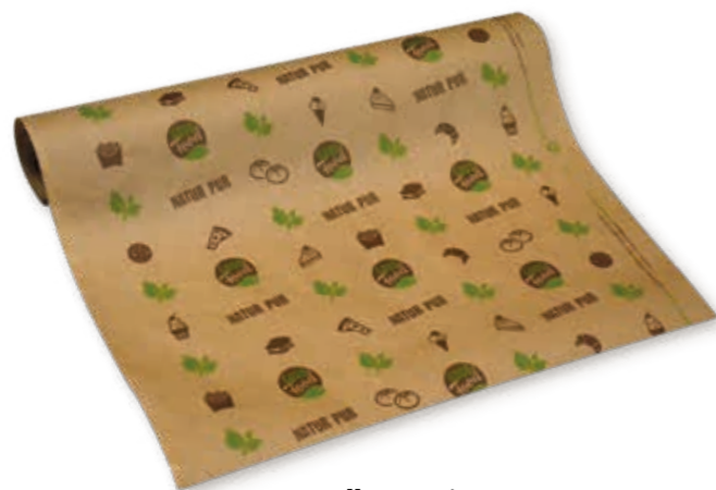
Rollenpapier „GOOD FOOD“ Art.-Nr. 573010