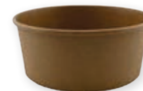
Food-Bowl Kraft 750 ml* 60 mm/Ø 149 mm Art.-Nr. 506102 + rPET-Deckel 500-1000 ml (Art.-Nr. 506200)