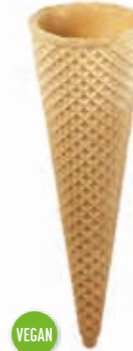
Waffeln Knuspertüten La Bella E9 gepresst · Höhe 140 mm/Ø 44 mm ca. 1-2 Kugel Art. Nr. 618509