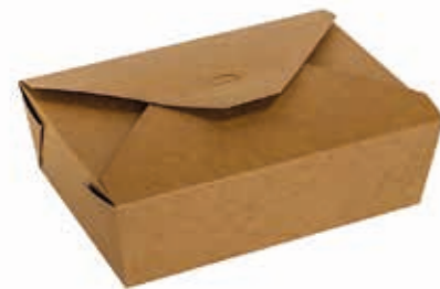
Lunch-Box Kraft 1500 - hoch* 1500 ml / 20 cm x 14 cm x 6,5 cm Art.-Nr. 506045