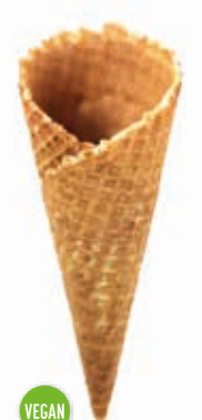
Süße Hörnchen Wenus süß gedreht · Höhe 130 mm/Ø 50 mm ca. 2-3 Kugel Art. Nr. 618527