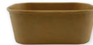
Familien-Packung Kraft 750 ml* 173 x 120 x 57 mm Art.-Nr. 519112 + Kraft-Deckel (Art.-Nr. 519119) + PP-Deckel (Art.-Nr. 519118)