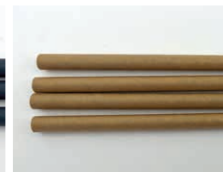
250 mm/Ø 8 mm Kraft-braun Art.-Nr. 579132