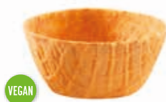
Becher Greta 90 ml Höhe 34 mm/Ø 75 mm Art.-Nr. 618495