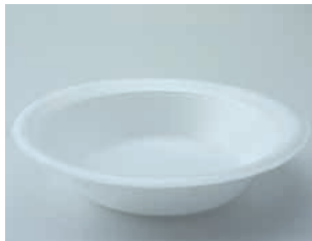
Spaghetti Schale Bagasse 400 ml / weiß rund Art.-Nr. 519010 + rPET-Hochdeckel / transparent / 4 cm (Art.-Nr. 519000)