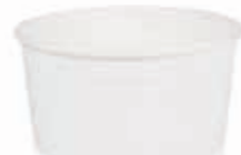
Becher W160 (GE-10) 160 ml/Höhe 45 mm/Ø 85 mm Art.-Nr. 508220