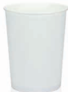
Becher W1000 (34oz) 1000 ml/Höhe 144 mm/Ø 114 mm Art.-Nr. 508270 + Flachdeckel ohne Loch (Art.-Nr. 512154) + Flachdeckel mit Kreuzschlitz (Art.-Nr. 512155)