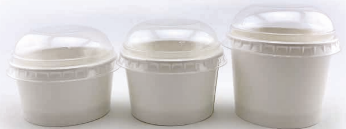
Modell 60 (GE-4) 60 ml randvoll/35 mm/Ø 65 mm Art.-Nr. 508201 + PET-Domdeckel (Art.-Nr. 512095)