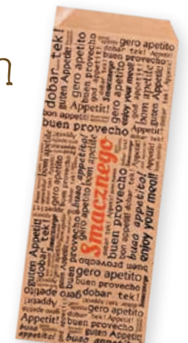
Hot-Dog-Tasche Kraft zweiseitig offen / 8,75 cm x 21,5 cm Art.-Nr. 506084