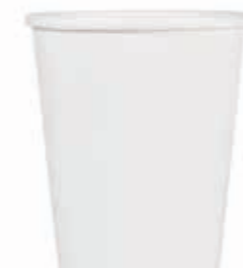
Becher W550 (W550) 550 ml/Höhe 112 mm/Ø 97 mm Art.-Nr. 508250 + Pappdeckel (Art.-Nr. 512224) + Deckel PP Eisbecher W550 fest/weiß (Art.-Nr. 512148) + Pappdeckel weiß mit Holzspaten (Art.-Nr. 512132)