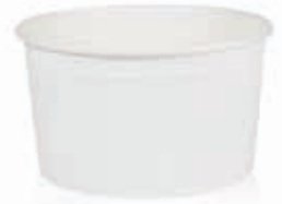
Becher W240 (GE-2M) 240 ml/Höhe 55 mm/Ø 94 mm Art.-Nr. 508234