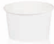
Becher W070 (GE-5) 80 ml/Höhe 40 mm/Ø 65 mm Art.-Nr. 508202 + PET-Domdeckel (Art.-Nr. 512095)*