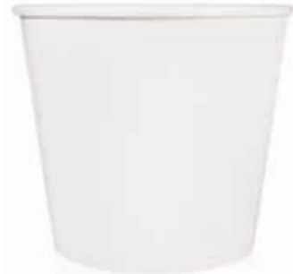
Becher W1170 (WP1000) 1170 ml/Höhe 120 mm/Ø 134 mm Art.-Nr. 508259 + Pappdeckel weiß (Art.-Nr. 512138) + Flachdeckel transparent (Art.-Nr. 512115)