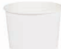
Becher W170 (GE-71) 170 ml/Höhe 55 mm/Ø 79 mm Art.-Nr. 508224