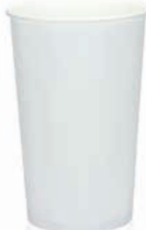
Becher W1310 (45oz) 1310 ml/Höhe 176 mm/Ø 118 mm Art.-Nr. 508271 + Flachdeckel ohne Loch (Art.-Nr. 512117)