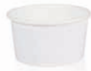
Becher W060 (GE-4) 60 ml/Höhe 35 mm/Ø 65 mm Art.-Nr. 508201

Neutral - und damit vielseitig einsetzbar. Unbedruckt kann manchmal die beste Lösung sein.