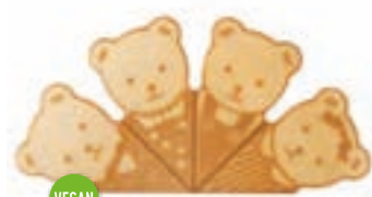
Bärchenwaffeln Höhe 93 mm Art. Nr. 618502