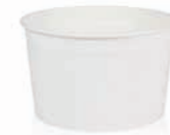
Becher W230 (GE-200) 230 ml/Höhe 57 mm/Ø 90 mm Art.-Nr. 508232 + Flachdeckel rPET (Art.-Nr. 512012)