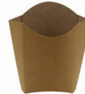
Pommes-Tasche Kraft* 9,5 cm x 5,0 cm Art.-Nr. 506060