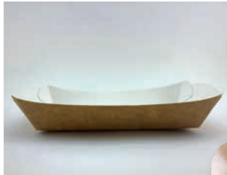
Bananaboat Box 21 x 12 x 4 cm (obere Abmessung) Art.-Nr. 546304