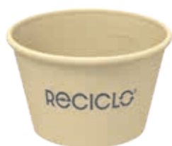
Mehrweg-Becher 150 sand ca. 150 ml/Höhe 49 mm/Ø 80 mm Art.-Nr. 525008 + Pappdeckel Kombi weiß (Art.-Nr. 516121) + Flachdeckel PET transparent (Art.-Nr. 512100)