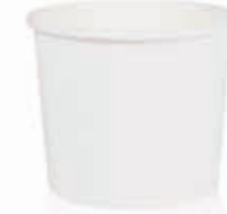
Becher W225 (GE-16) 220 ml/Höhe 66 mm/Ø 80 mm Art.-Nr. 508228 + Flachdeckel PET (Art.-Nr. 512100) + Flachdeckel rPET (Art.-Nr. 512011) + Pappdeckel Kombi (Art.-Nr. 516121)