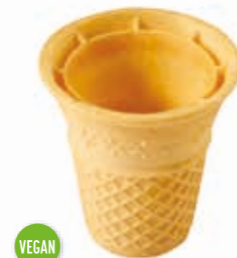
Eisbecher groß Doppelrand Höhe 70 mm/Ø 65 mm Art. Nr. 618573