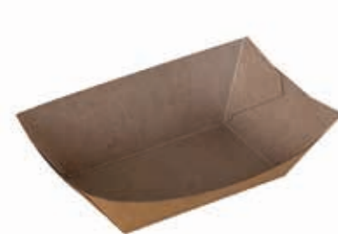
Food-Schale S* 8,5 cm x 5,1 cm x 3,6 cm Art.-Nr. 506025

Kraftpapier mit Fettbarriere Fettbeständig mit Feuchtigkeits-Dampfsperre ohne Plastikbeschichtung