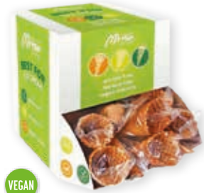
Waffeln Laura S101 glutenfrei Höhe 130 mm/Ø 50 mm Art. Nr. 618554