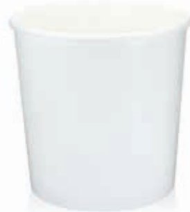
Becher W900 (GE-M90) 900 ml/Höhe 115 mm/Ø 118 mm Art.-Nr. 508258