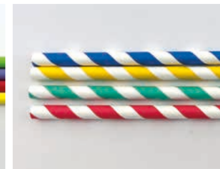
230 mm/Ø 8 mm bunt gestreift Art.-Nr. 579106