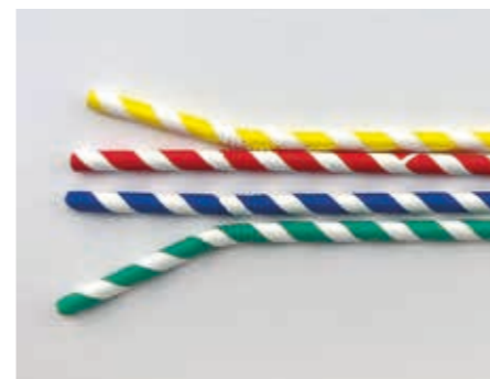
220 mm/Ø 5,8 mm farbig gemischt · flex Art.-Nr. 579102