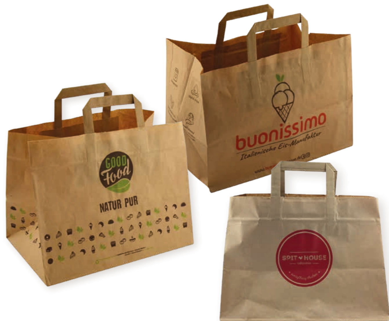
Papiertragetasche „GOOD FOOD“ 32 x 20 x 23 cm Art.-Nr. 573020