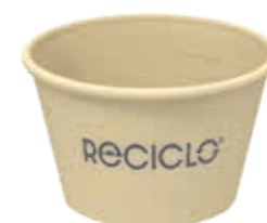
Mehrweg-Trinkbecher Cold & Hot S beige ca. 150 ml/Höhe 49 mm/Ø 80 mm Art.-Nr. 525008 + Mehrweg-Deckel schwarz (Art.-Nr. 525130) + Flachdeckel rPET mit Kreuzschlitz (Art.-Nr. 512011) + Pappdeckel Kombi weiß (Art.-Nr. 516121)