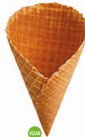
Waffeln Tivoli XL 0100 „Wundertüte“ süß gedreht · Höhe 173 mm/Ø 100 mm ca. 4-6 Kugel + Sahne Art. Nr. 618590