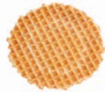
Waffeln Krossis E17 Ø 60 mm Art. Nr. 618517