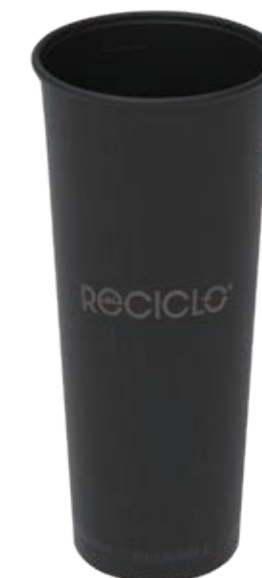
Mehrweg-Trinkbecher Cold & Hot XXL schwarz ca. 550 ml/Höhe 180 mm/Ø 80 mm Art.-Nr. 525125 + Mehrweg-Deckel schwarz (Art.-Nr. 525130) + Flachdeckel rPET mit Kreuzschlitz (Art.-Nr. 512011) + Pappdeckel Kombi weiß (Art.-Nr. 516121)