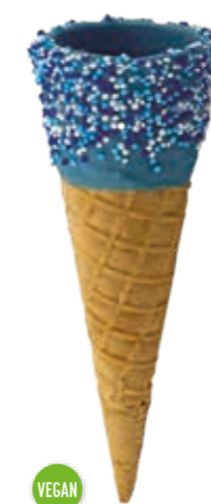
Waffel Hänsel S5243 blaue Glasur u. Streusel Höhe 160 mm/Ø 53 mm · ca. 2-3 Kugel Art. Nr. 618518