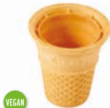
Eisbecher klein mit Doppelrand Höhe 60 mm/Ø 56 mm Art. Nr. 618568