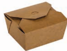
Lunch-Box Kraft 600* 600 ml / 11 cm x 9 cm x 6 cm Art.-Nr. 506042