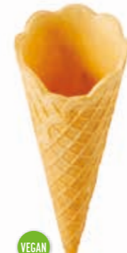
Knuspertüten La Ola O14 gepresst · Höhe 130 mm/Ø 51 mm ca. 1-2 Kugel Art. Nr. 618514