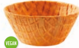
Becher Greta 170 ml Höhe 45 mm/Ø 93 mm Art. Nr. 618499