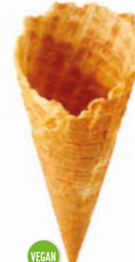
Copenhagen 0016 süß gedreht · Höhe 145 mm/Ø 62 mm ca. 2-3 Kugel Art. Nr. 618522