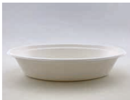
Banana Boat Bagasse 20,5 x 14,5 x 4 cm Art.-Nr. 519100