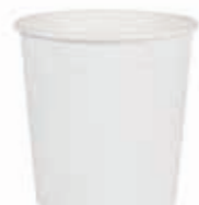
Becher W165 (125C) 165 ml/Höhe 69 mm/Ø 69 mm Art.-Nr. 508223 + Pappdeckel (Art.-Nr. 512222) + Pappdeckel mit Holzspaten (Art.-Nr. 512223) + Pappdeckel weiß mit Holzspaten (Art.-Nr. 512127) + Pappdeckel o. Löffel + Farbrand weiß (Art.-Nr. 512129)