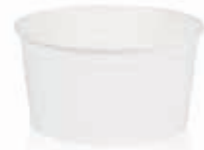
Becher W110F (GE-8) 110 ml/Höhe 40 mm/Ø 75 mm Art.-Nr. 508208 + Pappdeckel (Art.-Nr. 516120)