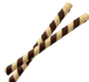
Hippe Roletto innen schokoliert Höhe 12,0 mm/Ø 10 mm Art. Nr. 618497