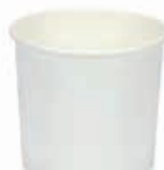
Becher W145 (100C) 140 ml/Höhe 60 mm/Ø 69 mm Art.-Nr. 508217 + Pappdeckel (Art.-Nr. 512222) + Pappdeckel mit Holzspaten (Art.-Nr. 512223) + Pappdeckel weiß mit Holzspaten (Art.-Nr. 512127) + Pappdeckel o. Löffel + Farbrand weiß (Art.-Nr. 512129)