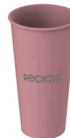
Mehrweg-Trinkbecher Cold & Hot XL altrosa ca. 430 ml/Höhe 147 mm/Ø 80 mm Art.-Nr. 525120 + Mehrweg-Deckel schwarz (Art.-Nr. 525130) + Flachdeckel rPET mit Kreuzschlitz (Art.-Nr. 512011) + Pappdeckel Kombi weiß (Art.-Nr. 516121)