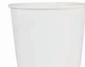
Becher W750 (GE-M75) 750 ml/Höhe 100 mm/Ø 118 mm Art.-Nr. 508253 + Flachdeckel ohne Loch (Art.-Nr. 512117)