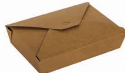
Lunch-Box Kraft 1100 - flach* 1100 ml / 20 cm x 14 cm x 4,5 cm Art.-Nr. 506044