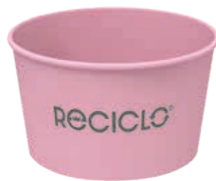
Mehrweg-Becher 400 lavendel ca. 400 ml/Höhe 65 mm/Ø 110 mm Art.-Nr. 525016 + Domdeckel PET transparent (Art.-Nr. 512110) + Flachdeckel PET (Art.-Nr. 512111) + Pappdeckel weiß (auch mit Holzlöffel) Art.-Nr. 512209