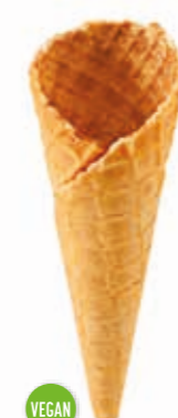
Waffeln Kolding 265 süß gedreht · Höhe 135 mm/Ø 45 mm ca. 2-3 Kugel Art. Nr. 618529