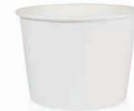
Becher W500 (GE-4M) 500 ml/Höhe 79 mm/Ø 110 mm Art.-Nr. 508248 + PET-Flachdeckel (Art.-Nr. 512111) + PET-Domdeckel (Art.-Nr. 512110) + Pappdeckel (Art.-Nr. 512209) + Pappdeckel mit Holzspaten (Art.-Nr. 512210)