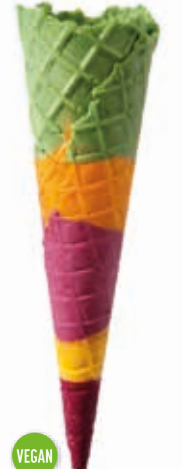
Waffel Hörnchen Kakadu Höhe 172 mm/Ø 45 mm ca. 2-3 Kugel Art. Nr. 618447