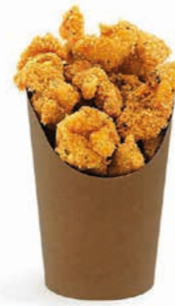
Wrap-Becher Kraft* 8,5 cm x 6,0 cm x 12,0 cm Art.-Nr. 506066