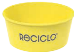
Mehrweg-Becher 300 limone ca. 300 ml/Höhe 47 mm/Ø 110 mm Art.-Nr. 525012 + Domdeckel PET transparent (Art.-Nr. 512110) + Flachdeckel PET (Art.-Nr. 512111) + Pappdeckel weiß (auch mit Holzlöffel) Art.-Nr. 512209