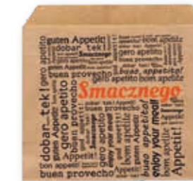
Fritten-Tasche Kraft einseitig oben offen / 14 cm x 10 cm Art.-Nr. 506082