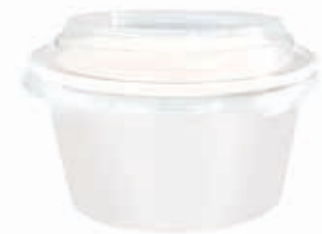
Becher W580 580 ml/Höhe 65 mm/Ø 132 mm Art.-Nr. 508249 + PET-Hochdeckel (Art.-Nr. 512151)