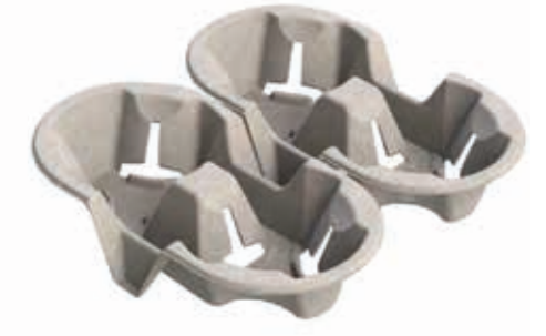
Becherhalter aus Papierpulpe 2er/4er (460-2er/230-4er) / 18,0 cm x 18,0 cm x 5,0 cm Art.-Nr. 639131