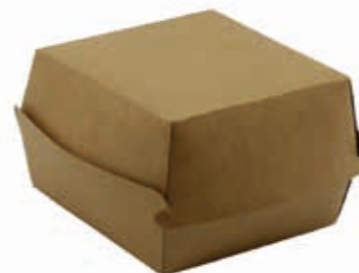
Burger Box XL* 11 cm x 11 cm x 7,7 cm Art.-Nr. 506030