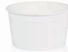
Becher W200 (GE-20) 190 ml/Höhe 50 mm/Ø 85 mm Art.-Nr. 508226 + Pappdeckel (Art.-Nr. 512220) + Pappdeckel (Art.-Nr. 512082) + Pappdeckel weiß mit Holzspaten (Art.-Nr. 512089) + PET-Flachdeckel (Art.-Nr. 512098) + PET-Domdeckel (Art.-Nr. 512099)