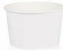
Becher W130 (GE-108) 130 ml/Höhe 49 mm/Ø 76 mm Art.-Nr. 508210 + PLA-Flachdeckel (Art.-Nr. 512097)