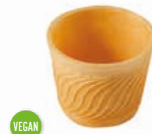
Eisbecher 250 ml Höhe 65 mm/Ø 90 mm Art. Nr. 618576