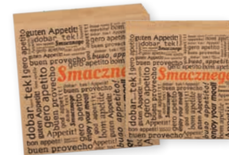
Hamburger-Tasche Kraft zweiseitig offen / 15 cm x 16 cm - Art.-Nr. 506080 zweiseitig offen / 17,5 cm x 17 cm - Art.-Nr. 506081