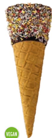
Waffel Roma S5218 schokoliert, bunte Streusel Höhe 160 mm/Ø 53 mm · ca. 2-3 Kugel Art. Nr. 618534