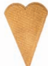
Herzwaffel E38 Höhe 90 mm/Breite 66 mm Art. Nr. 618535