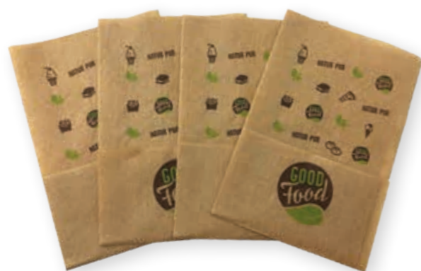
Servietten „GOOD FOOD“ ca. 17 x 17 cm Art.-Nr. 580016