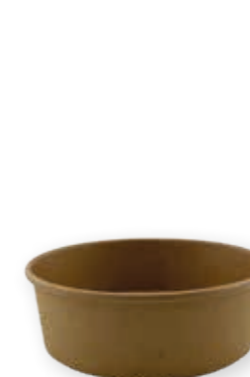
Food-Bowl Kraft 500 ml* 50 mm/Ø 149 mm Art.-Nr. 506100 + rPET-Deckel 500-1000 ml (Art.-Nr. 506200)