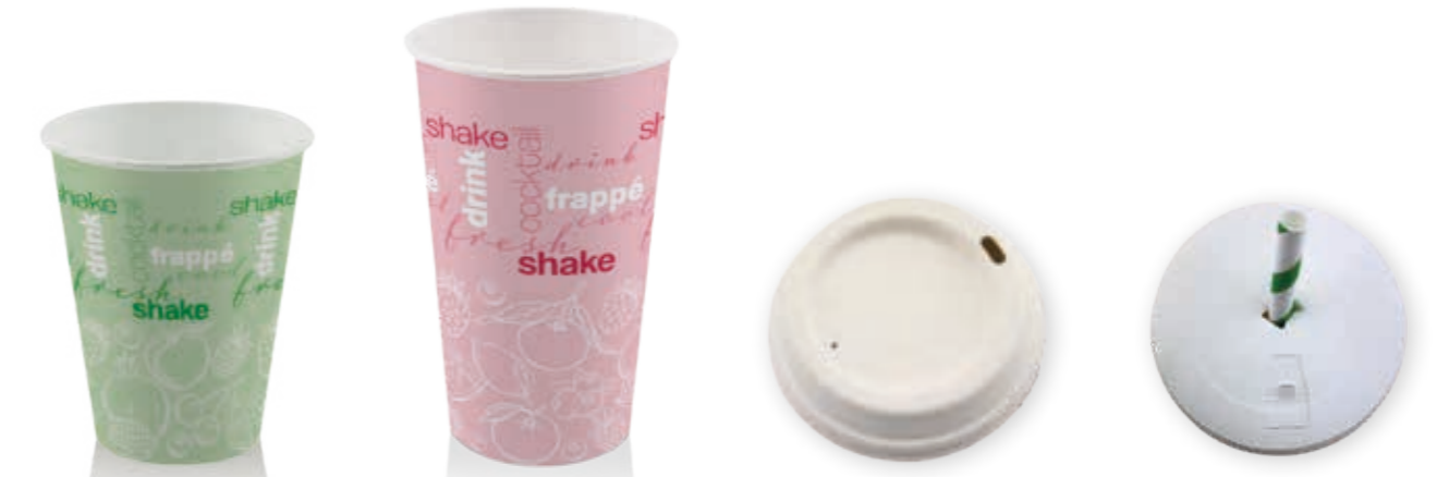
CUPPAP® Trinkbecher GE-T42F 450 ml/Höhe 111 mm/Ø 90 mm Art.-Nr. 510145 + rPET-Flachdeckel m. Kreuzschlitz (Art.-Nr. 512012) + Pappdeckel m. Kreuzschlitz (Art.-Nr. 516122) CUPPAP® Trinkbecher GE-T58 580 ml/Höhe 150 mm/Ø 90 mm Art.-Nr. 510158 + rPET-Flachdeckel m. Kreuzschlitz (Art.-Nr. 512012) + Pappdeckel m. Kreuzschlitz (Art.-Nr. 516122) BAGASSEDECKEL für CTG creme Ø 80 mm (Art.-Nr. 516114) Ø 90 mm (Art.-Nr. 516122) PAPPDECKEL Kombi mit Kreuzschlitz und Trinkloch Ø 80 mm (Art.-Nr. 516121) Ø 90 mm (Art.-Nr. 516122)