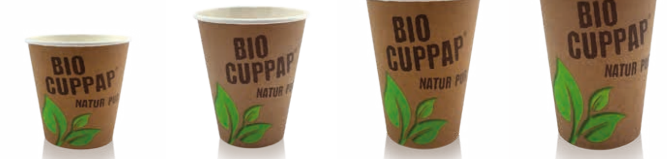
BIO CUPPAP® Hot 100 100ml randvoll/Höhe 61 mm/Ø 62 mm Art.-Nr. 514128 BIO CUPPAP® Hot 200 8 oz/Höhe 91 mm/Ø 80 mm Art.-Nr. 514130 + Bagassedeckel CTG creme (Art.-Nr. 516114) + CPLA Deckel CTG weiß (Art.-Nr. 516104) + Pappdeckel Kombi (Art.-Nr. 516121) BIO CUPPAP® Hot 300 12 oz/Höhe 112 mm/Ø 90 mm Art.-Nr. 514134 + Bagassedeckel CTG creme (Art.-Nr. 516118) + CPLA Deckel CTG weiß (Art.-Nr. 516108) + Pappdeckel Kombi (Art.-Nr. 516122) BIO CUPPAP® Hot 400 16 oz/Höhe 130 mm/Ø 90 mm Art.-Nr. 514136 + Bagassedeckel CTG creme (Art.-Nr. 516118) + CPLA Deckel CTG weiß (Art.-Nr. 516108) + Pappdeckel Kombi (Art.-Nr. 516122)