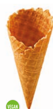
Süße Hörnchen Dani 0047N süß gedreht · Höhe 130 mm/Ø 55 mm ca. 2-3 Kugel Art. Nr. 618547