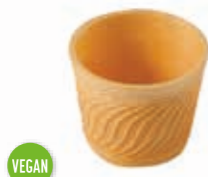
Eisbecher 150 ml Höhe 62 mm/Ø 76 mm Art. Nr. 618574