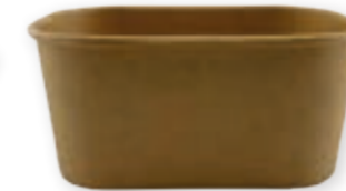
Familien-Packung Kraft 1000 ml* 173 x 120 x 75 mm Art.-Nr. 519114 + Kraft-Deckel (Art.-Nr. 519119) + PP-Deckel (Art.-Nr. 519118)