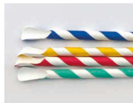
200 mm/Ø 8 mm Papiertrinkhalm mit Löffel · bunt gestreift Art.-Nr. 579120