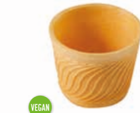
Eisbecher 400 ml Höhe 77 mm/Ø 102 mm Art. Nr. 618578