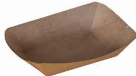
Food-Schale L* 13,7 cm x 8,6 cm x 5,2 cm Art.-Nr. 506027