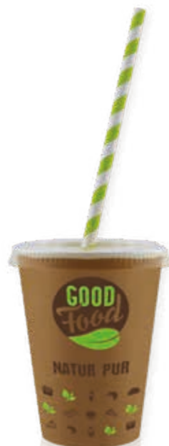
Trinkbecher „GOOD FOOD“ 450 ml/Höhe 113 mm/Ø 90 mm Art.-Nr. 510120

+ rPET Flachdeckel m. Kreuzschlitz (Art.-Nr. 512012) + rPET Pappdeckel m. Kreuzschlitz (Art.-Nr. 516122)