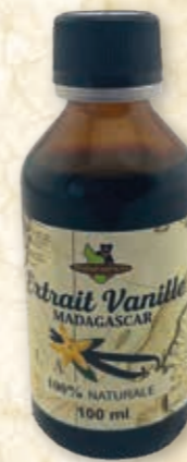
Bourbon-Vanille Extrakt 2,5fach · ohne Alkohol 215072 / 100ml Flasche