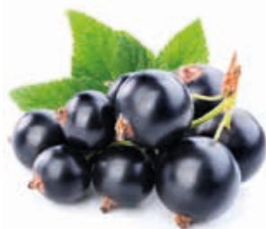
Cassis 100% (schw. Johannisbeer) 222016 / 1,5 kg Beutel°