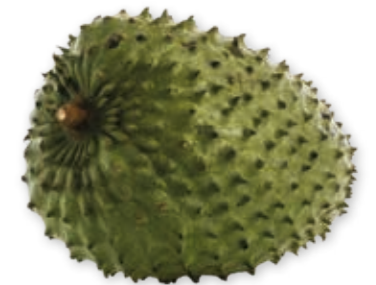
Guanabana 100% 222064 / 5 kg BiB