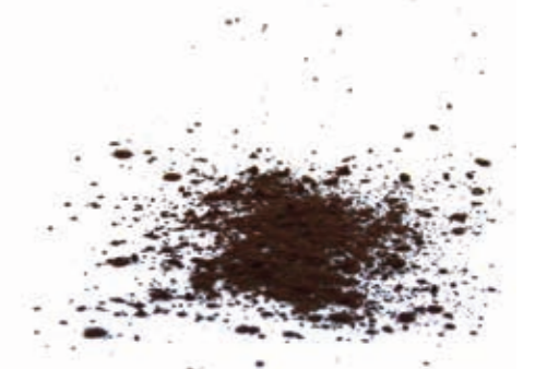
Schwarzer Cacao 10/12 215090 / 5 kg Eimer