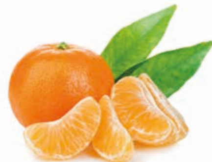
Mandarine 100% 222084 / 5 kg BiB