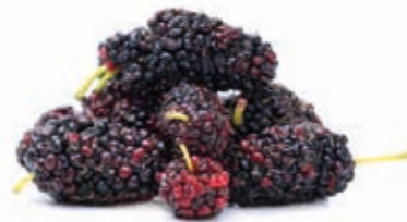
Andenbrombeere 100% (Mora) 222062 / 5 kg BiB