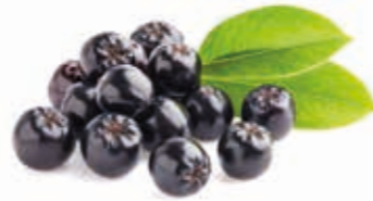
Aroniasaft 100% 222063 / 1,5 l BiB