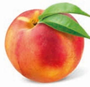
Pfirsich 100% 222034 / 1,5 kg Beutel* 222035 / 5 kg BiB