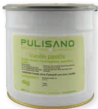
Vanille pastös aus 100% gemahlener Vanille 215034 / 4 kg Dose