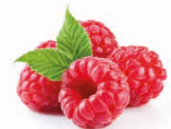
Himbeere rot 1) 222024 / 1,5 kg Beutel°