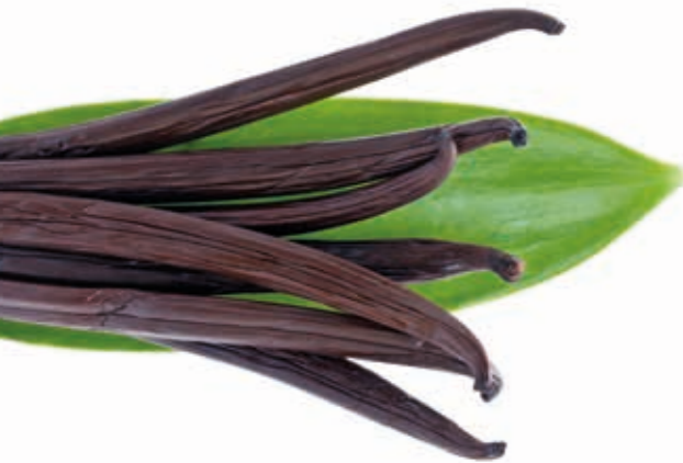
Bourbon Vanille Schoten 13-15 cm 215038 / 1 kg Beutel