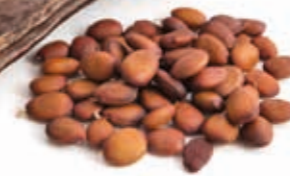
Johannisbrotkernmehl 2800-3000 cps 215102 / 5 x 1 kg Beutel