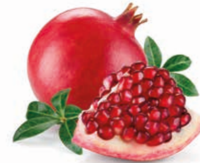
Granatapfel 1) 222042 / 1,5 kg Beutel°