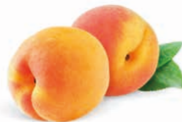
Aprikose 100% 222010 / 1,5 kg Beutel 222011 / 5 kg BiB