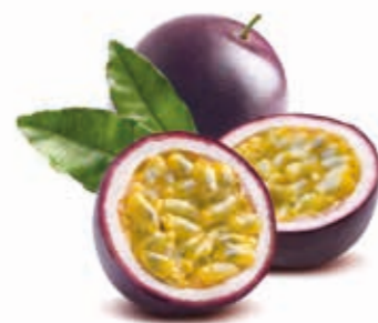
Maracuja 100% 222026 / 1,5 kg Beutel 222027 / 5 kg BiB