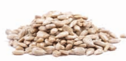
Sonnenblumenkernmark 100% fein gemahlen 215018 / 3 kg Dose