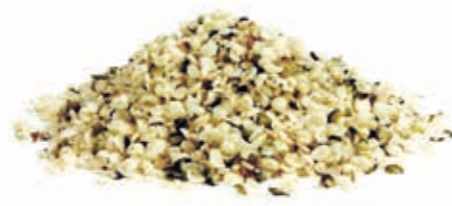
Hanfsamenmark 100% 215048 / 3 kg Dose