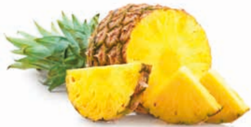
Ananas (fein) 100% 222060 / 5 kg BiB Ananas (grob) 100% 222012 / 1,5 kg Beutel