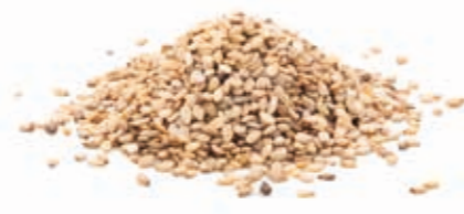
BIO Sesamsamenmark 100% 215280 / 10 kg Eimer*