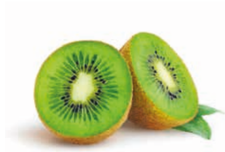
Kiwi 100% 222040 / 1,5 kg Beutel*