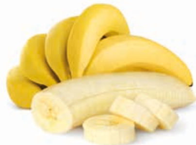
Banane 100% 222014 / 1,5 kg Beutel°