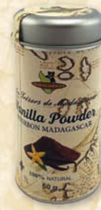
Bourbon-Vanille fein gemahlen 215035 / 50 g Dose