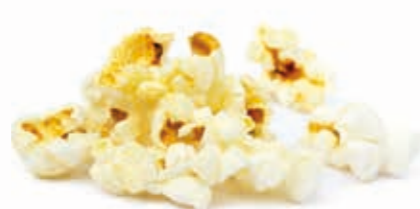
Popcornpaste 215044 / 3 kg Dose