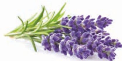
Lavendelblütenwasser 215043 / 1 l Flasche