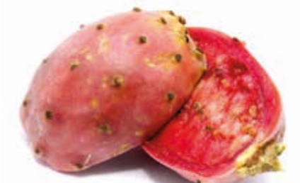
Kaktusfeige 100% 222094 / 3 kg BiB