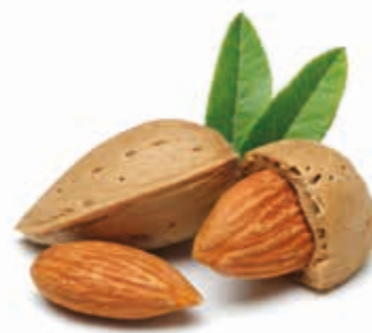
BIO Mandelmus 100% 215272 / 10 kg Eimer*