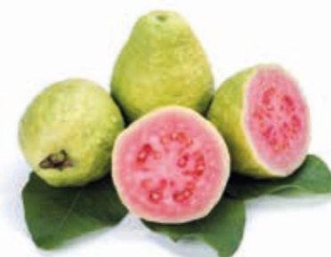
Guave Pink 100% 222067 / 3,1 kg Dose