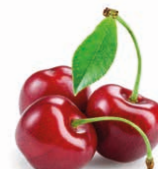
Sauerkirsche 1) 222046 / 1,5 kg Beutel