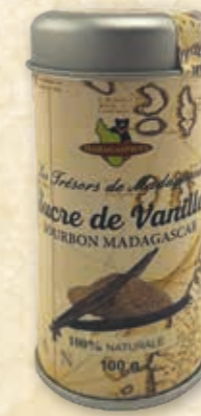
Bourbon Vanillezucker Premium 7% · extra fein 215074 / 100 g Dose