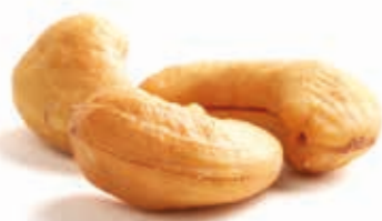
BIO Cashewmus 100% 215250 / 10 kg Eimer*