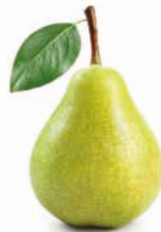
Birne Williams 100% 222032 / 1,5 kg Beutel 222033 / 5 kg BiB