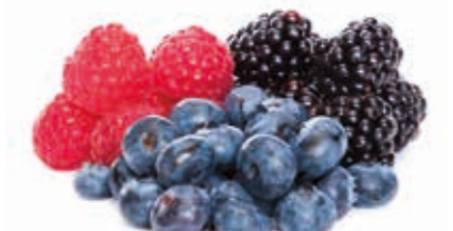
Waldfrucht 100% 222020 / 1,5 kg Beutel*