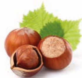
Haselnussmark 100% medium geröstet, fein gemahlen 215012 / 5 kg Eimer