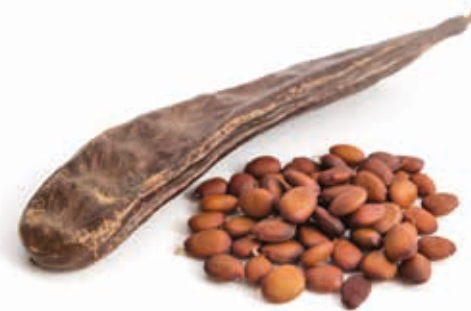
Neuro G/J 215110 / 5 x 1 kg Beutel*