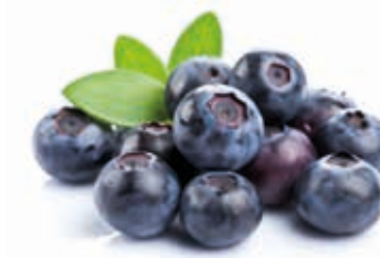
Heidelbeere 100% schwarz ital. #222028 / 1,5 kg Beutel Heidelbeere 100% schwarz #222029 / 3 kg BiB #222081 / 20 kg BiB