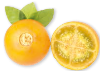
Lulo 100% 222082 / 5 kg BiB