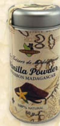
Bourbon-Vanille fein gemahlen

Premium 7% · extra fein #215074 / 100 g Dose