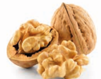
Walnussmark 100% fein gemahlen 215032 / 3 kg Eimer