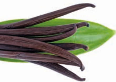
Bourbon Vanille Schoten 13-15 cm