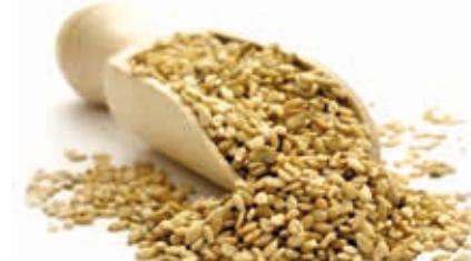
Sesamsamenmark 100% hell 215046 / 3 kg Dose*