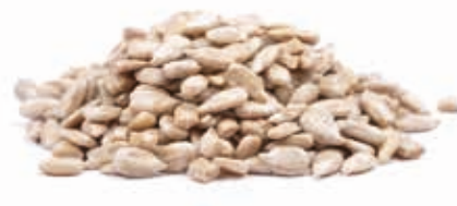
Sonnenblumenkernmark 100% fein gemahlen 215018 / 3 kg Dose