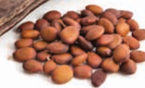
Johannisbrotkernmehl 2800-3000 cps 215102 / 5 x 1 kg Beutel