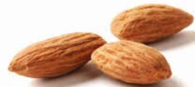
Mandelmus 100% fein gemahlen 215028 / 3 kg Eimer