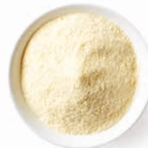
Milchbase „Natur 30“ 215006 / 10 kg Sack