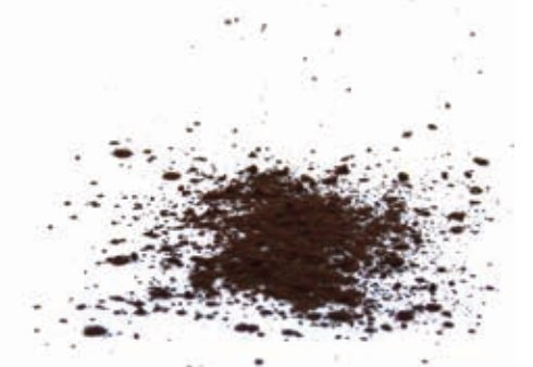
Schwarzer Cacao 10/12 215090 / 5 kg