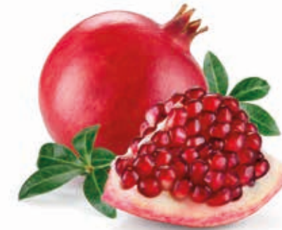
Granatapfel türkisch 1) #222042 / 1,5 kg Beutel Granatapfel naturrüb #222043 / 3 kg BiB #222080 / 20 kg BiB