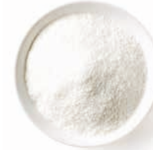
Fruchtbasis „Natur 30“ 215008 / 10 kg Sack