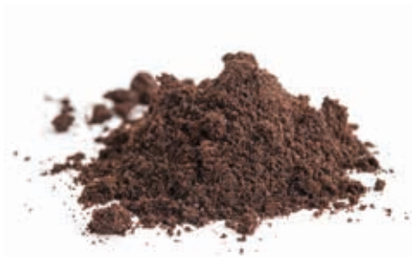
Bourbon Vanille fein gemahlen

#215036 / 1 kg Beutel #215075 / 10 kg Beutel