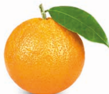
Orange 100% #222083 / 3 kg BiB #222095 / 25 kg BiB