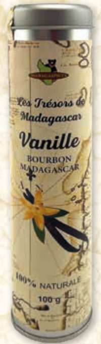
Bourbon Vanille Schoten