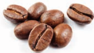
Caffè Natur 100% 215050 / 2,5 kg Dose