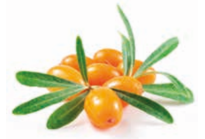
Sanddorn 100% mit natürlichem Sanddornöl 222036 / 3 Liter BiB