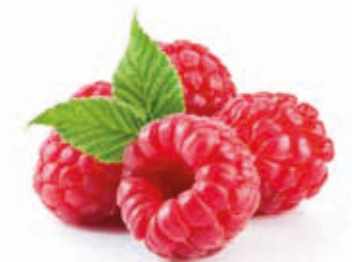
Himbeere rot 1) #222024 / 1,5 kg Beutel Himbeere rot #222025 / 3 kg BiB #222085 / 20 kg BiB