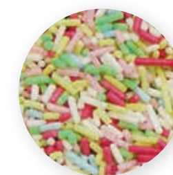
Zuckerstreusel 100% Natur 258006 / 8 Beutel à 1 kg