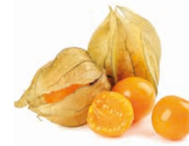
Physalis 100% 222090 / 5 kg BiB