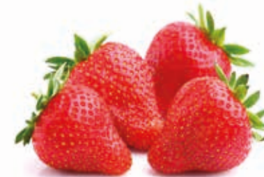
Erdbeere 1) „sonnengereift“ #222018 / 1,5 kg Beutel Erdbeere pur #222019 / 3 kg BiB #222079 / 10 kg BiB