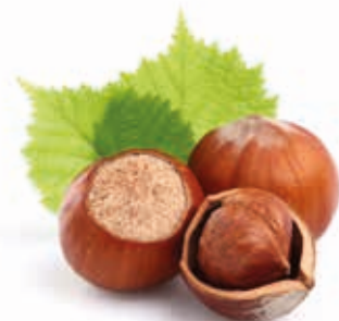
BIO Haselnussmark 100% fein 215260 / 10 kg Eimer*