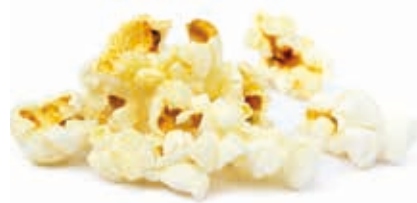
Popcornpaste 215044 / 3 kg Dose