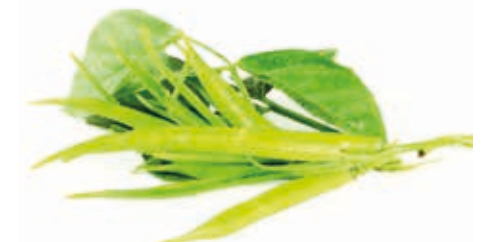
Guarkernmehl 5000 cps, 200 msh 215108 / 5 x 1 kg Beutel