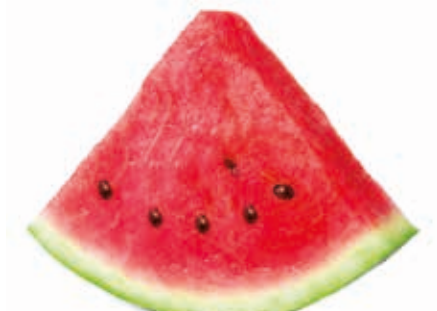
Wassermelone #222088 / 3 kg BiB #222089 / 20 kg BiB