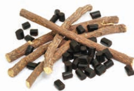
Lakritz pastös 100% intensiv 215041 / 1 kg Flasche