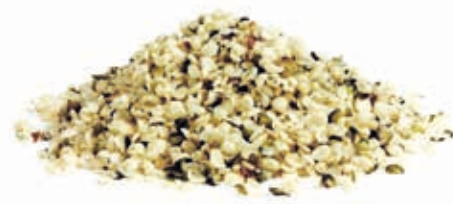
Hanfsamenmark 100% 215048 / 3 kg Dose