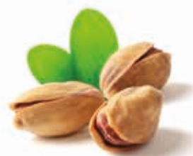
BIO Pistazienmark 100% 215276 / 10 kg Eimer*