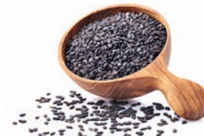
Sesamsamenmark 100% schwarz 215047 / 3 kg Dose*