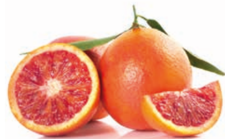
Blutorange 100% #222077 / 3 kg BiB