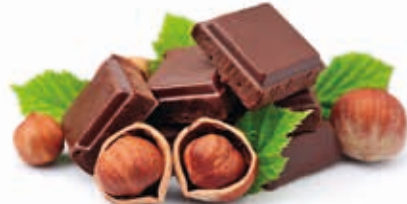
Gianduia Natur 100% 215056 / 5 kg Eimer