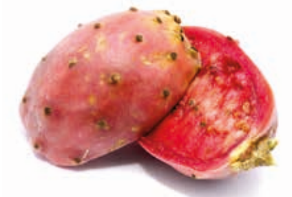
Kaktusfeige 100% #222094 / 3 kg BiB