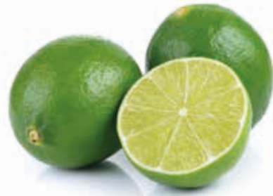
Limette Tahiti 100% 222068 / 5 kg BiB