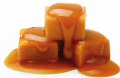
Karamell Mou Natur 100% 215062 / 5 kg Eimer