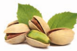
Pistazienmark 100% mediterran, fein gemahlen 215020 / 3 kg Dose