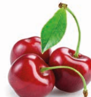
Sauerkirsche 1) italienisch #222046 / 1,5 kg Beutel Sauerkirsche pur #222047 / 3 kg BiB #222048 / 10 kg BiB