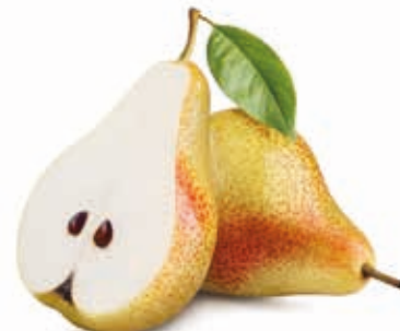
Birne 100% #222076 / 10 kg BiB