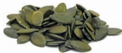
Kürbiskernmark 100% fein gemahlen 215016 / 3 kg Dose