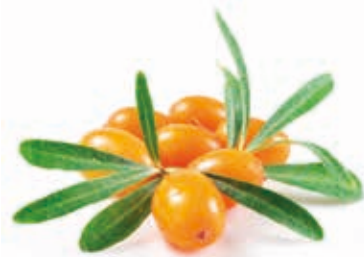
BIO Sanddorn-Püree 100% 215210 / 3 Liter BiB