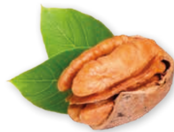
Pekannussmark 100% fein gemahlen 215024 / 3 kg Dose