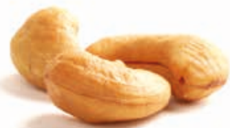
Cashewmus 100% fein gemahlen 215030 / 3 kg Dose