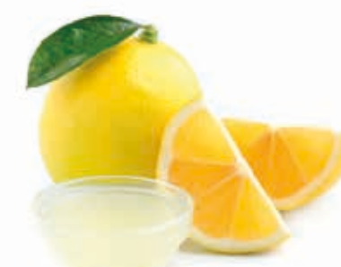
gepr. Zitronensaft aus siz. Zitronen #217000 / 1 Liter Flasche