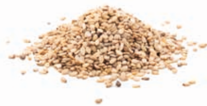
BIO Sesamsamenmark 100% 215280 / 10 kg Eimer*