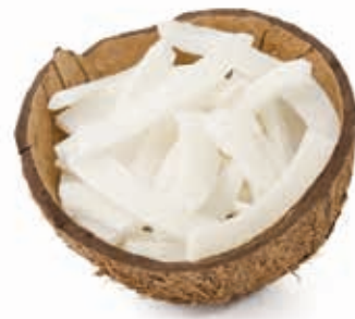
Kokosnusmark 100% feste Konsistenz, fein gemahlen 215031 / 5 kg Eimer