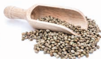
BIO Hanfsamenmark 100% 215258 / 10 kg Eimer*