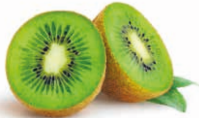
Kiwi 100% #222040 / 1,5 kg Beutel #222041 / 10 kg BiB