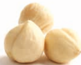
Macadamiamus 100% fein gemahlen 215022 / 3 kg Eimer