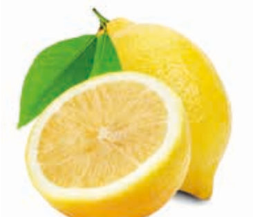
Zitronen 100% #217005 / 3 kg BiB #222071 / 25 kg BiB