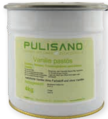
Vanille pastös aus 100% gemahlener Vanille