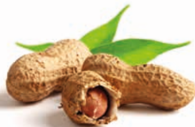
BIO Erdnussmark 100% 215254 / 10 kg Eimer*