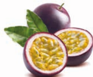
Maracuja 100% #222026 / 1,5 kg Beutel #222027 / 5 kg BiB #222030 / 20 kg BiB