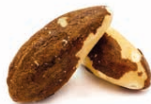
Paranusmark 100% fein gemahlen 215026 / 3 kg Dose