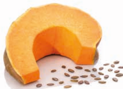
BIO Kürbiskernmark 100% 215268 / 10 kg Eimer*