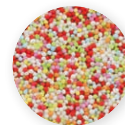
Nonpareille-Kügelchen 100% Natur 258002 / 8 Beutel à 1 kg