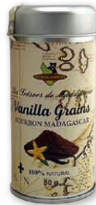
Bourbon-Vanillemark (grains, getrocknet)

#215036 / 1 kg Beutel #215075 / 10 kg Beutel