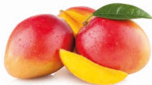
Mango indisch Alphonso 100% #244006 / 3,1 kg Dose #244005 / 20 kg BiB