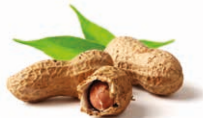
Erdnussmark 100% fein gemahlen 215014 / 5 kg Eimer